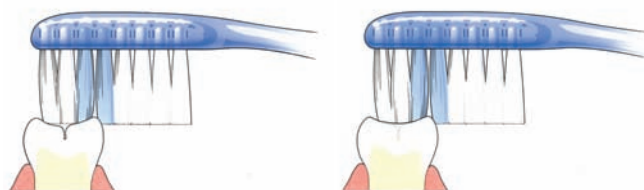
Tandenborstel komt niet in de groef

Bij zowel melkkiezen als blijvende kiezen zitten veel groefjes op het kauwvlak. Daarin ontstaat gemakkelijk tandplak. Niet regelmatig verwijderde plak kan gaatjes veroorzaken. Goed poetsen dus. Om het kauwvlak goed te beschermen, kan de tandarts een laagje 'kunsthars' (sealant) aanbrengen. Dit heet 'sealen'. Diepe groeven kan uw tandarts door het sealen afdichten. Alleen de blijvende kiezen komen normaal gesproken in aanmerking om te sealen. Dit gebeurt meestal kort nadat de blijvende kiezen helemaal zijn doorgebroken. De tandarts zal alleen sealen als hij verwacht dat er gaatjes in de groefjes ontstaan. Ook gesealde kiezen moeten goed worden gepoetst.