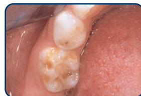
Een kaaskies in een melkgebit

Kaaskiezen zijn kiezen met plekken waarvan het glazuur minder hard is. Deze plekken zijn herkenbaar aan de geelbruine verkleuringen. Meestal treden ze op bij de eerste grote kiezen (zie foto's). De afwijking kan zich beperken tot enkele plekkjes, maar ook kan een heel vlak worden aangetast. In kaaskiezen ontstaan vaak gaatjes. Ook kunnen ze snel afbrokkelen door slijtage. Ze zijn vaak gevoelig voor koud en warm en ook zoetigheid doet vaak zeer. Kinderen met kaaskiezen vermijden daarom wel vaker zoetigheden. Denkt u dat uw kind last heeft van kaaskiezen? Neem dan contact op met uw tandarts.