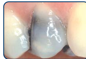
Grijze of zwarte vulling