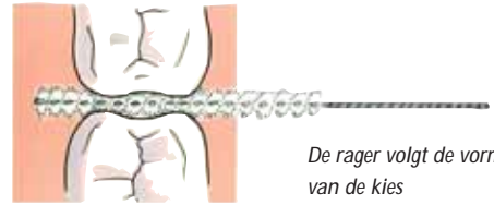
De rager volgt de vorm van de kies

In het begin is het gebruik van ragers soms moeilijk en pijnlijk. Het tandvles gaat dan gemakkelijk bloeden omdat het nog ontstoken is. Als u de rager dagelijks gebruikt, verdwijnt de ontsteking en dus ook het bloeden. Bovendien wordt het gebruik minder pijnlijk.