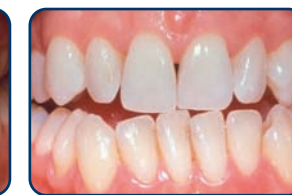
Resultaat na tien dagen bleken met de thuisbleekmethode onder begeleiding van de tandarts