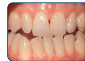
Voor het bleken

De lengte van een bleekbehandeling hangt af van de bleekmethode. Bij de thuisbleekmethode duurt het meestal twee weken voordat u een gewenst resultaat bereikt.